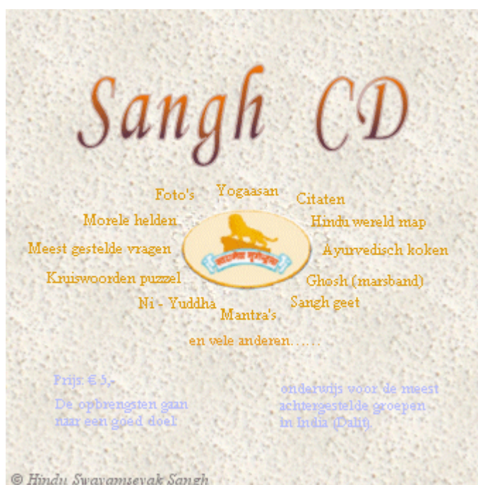
Voorkant van de Sangh CD