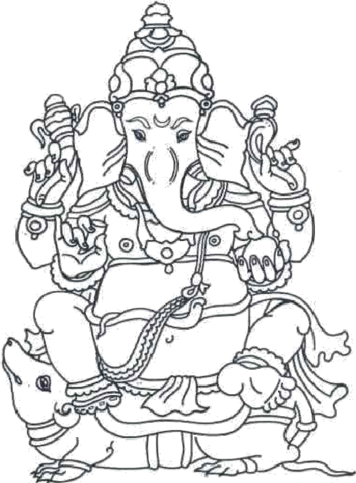
Illustration by Kiran Singh