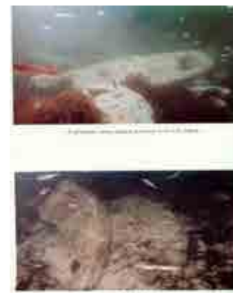
Stukken onderwater van Dwarika