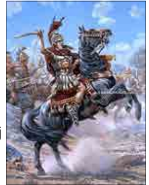
Alexander de Grote

Maar Alexander de Grote wilde nog meer dan alleen Perzië. Zo veroverde hij onder andere ook Egypte. Maar Alexander wilde nog steeds meer. Hij wilde tot aan het “eind van de wereld” veroveren en toevoegen aan zijn rijk. Daarom liet hij zijn oog vallen op Bharat.