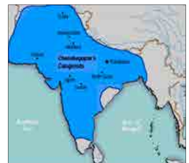
Bharat ten tijde van Chandragupta

Hiermee was er nog geen eind gekomen aan de totale Griekse Invasie. Uiteindelijk hebben de Grieken vier keer geprobeerd om India te veroveren, maar telkens zonder succes. Zo probeerde bijvoorbeeld Dimitrius Bharat te veroveren, maar werd gestuit door Kharavela, koning van Ayodhya.